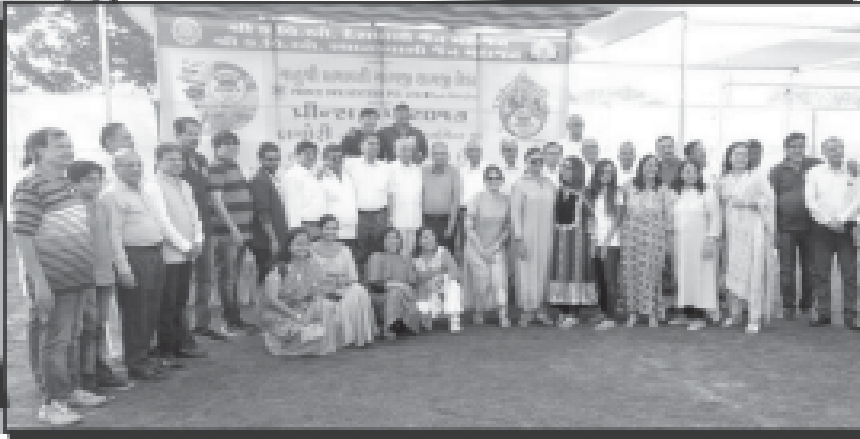
બંને મહાજનના પદાધિકારીઓ-ટીમ ઓનર્સ-દાતા પરિવાર