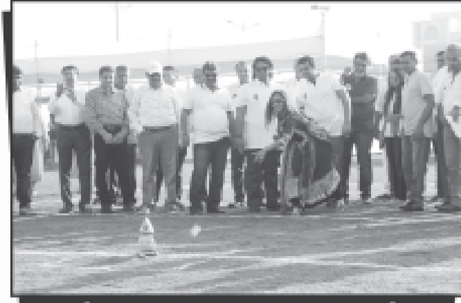
લગોરી રમતા દાતા પરિવારના રૂપલ છેડા