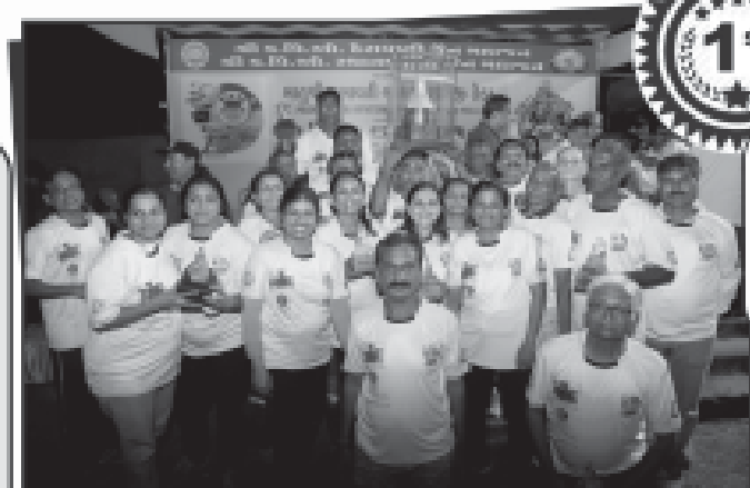
બોરીવલી સ્ટાર્સ - લગોરી - પ્રથમ વિજેતા