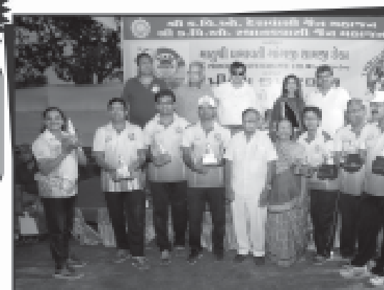
શ્રી મલાડ કચ્છી જૈન યુવક સમાજ - લગોરી -

આયોજનમાં કોઈ ભૂલ થઈ હોય, અગવડ પડી હોય કે કોઈનું સહાય મળ્યો છે આપનો સાથ સહકાર... આભાર આપ સૌનો...મળતો રહે.