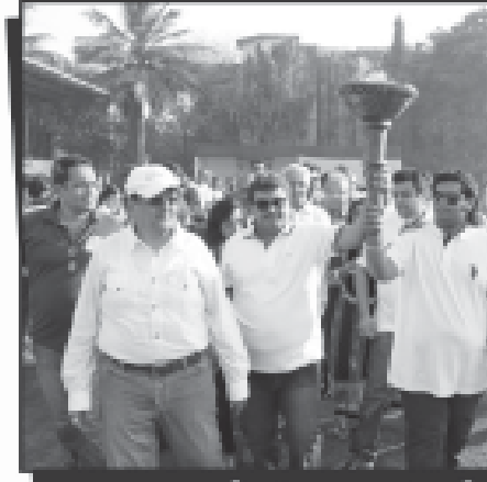
મશાલ સાથે પિયુષભાઈ અને